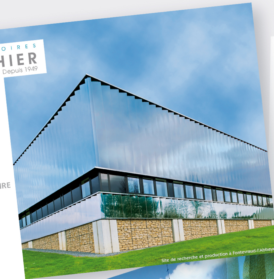
Site de recherche et production à Fontevraud-l'Abbaye